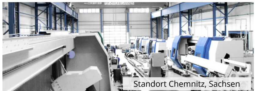
Standort Chemnitz, Sachsen

Anwendungen in den Bereichen Drehen, Fräsen, Bohren, Schleifen und Verzahnen wurden erfolgreich umgesetzt. Dies auch in Verbindung mit Messprozessen und Automatisierungen. Das variable Baukastensystem und der modular gestaltete Maschinenaufbau ermöglicht ein Maximum an Flexibilität und Effizienz. NILES-SIMMONS steht für Zuverlässigkeit, Präzision sowie Qualität „Made in Germany“.