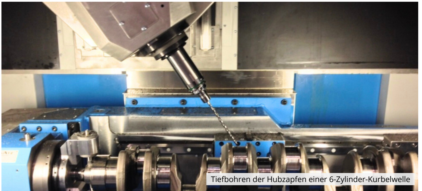
Tiefbohren der Hubzapfen einer 6-Zylinder-Kurbelwelle